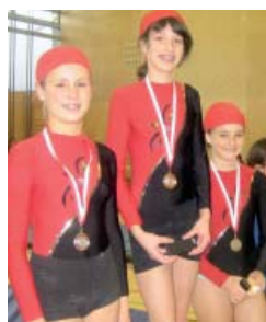
Dreifach-Sieg im Gerätturnen, AK12.

Die TS Göfis holte bei den Bezirksmeisterschaften Oberland/Walgau hervorragende Ergebnisse. Bei der Teilnahme in gesamt 12 Klassen gab es Siege in 8 Klassen!