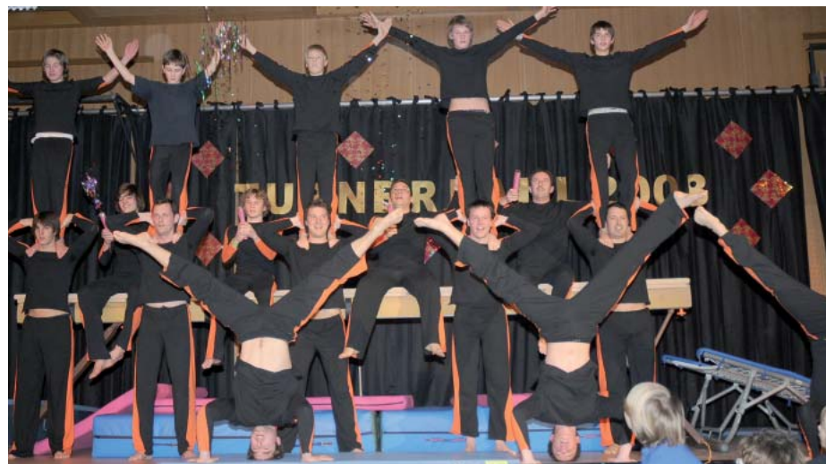
Mehr als 120 Turner/innen der TS Göfis traten beim Turnerball auf. Den begeisterten Zusehern wurde so die ganze Vielfalt des Vereines präsentiert.